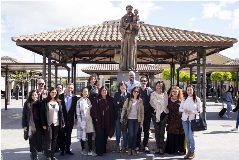
Participanții la activitatea de învățare din Murcia (ES)