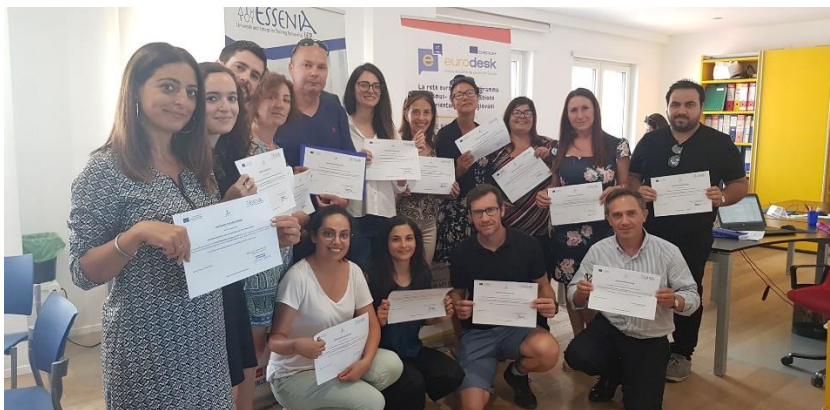
Participanții care afișează certificate de finalizare a activității din Salerno.(IT)